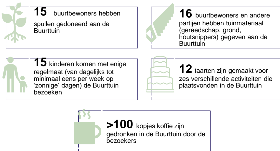
Figuur 2. Directe resultaten Buurttuin De Kempenaar