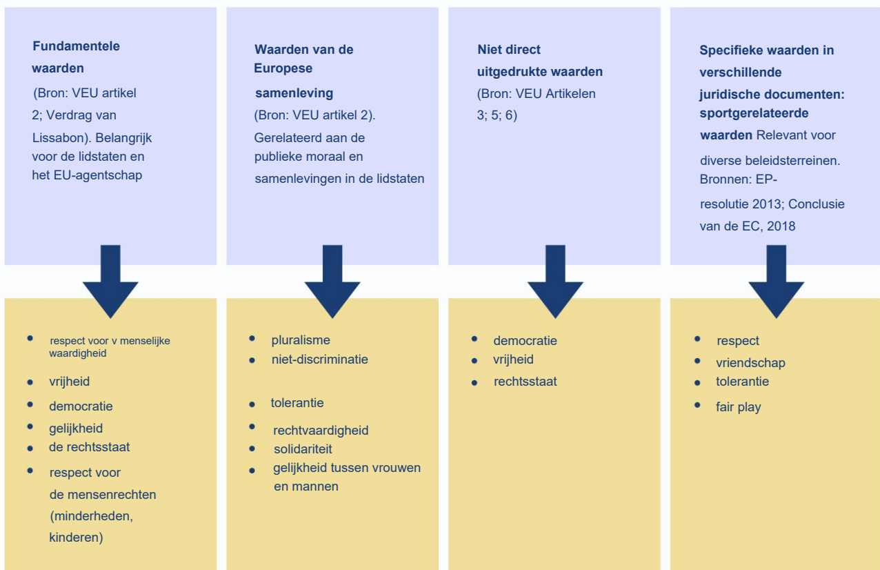
Tabel 1. Soorten fundamentele en specifieke waarden van de EU

Sommige van deze waarden, zoals mensenrechten, menselijke waardigheid, sociale rechtvaardigheid en solidariteit, worden expliciet beschreven in artikel 2. Waarden als democratie, vrijheid en de rechtsstaat worden door advocaten uitgelegd als vereisten (landen kunnen deze specificeren) Frischhut, 2022). Transparantie en duurzaamheid worden door het VEU als beginselen gedefinieerd (VEU, art. 3 en art. 5).