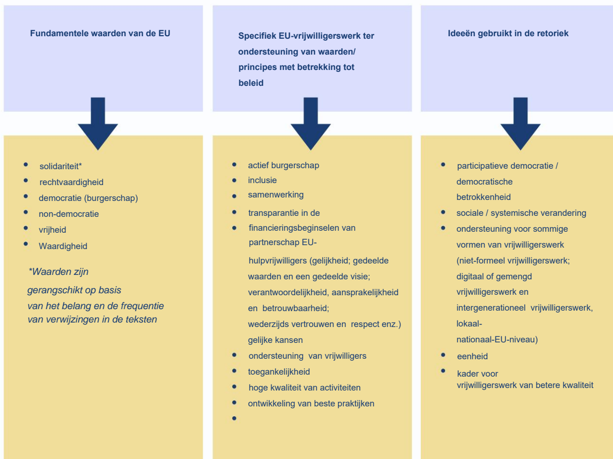
Tabel 2. EU-waarden worden het vaakst geassocieerd met vrijwilligerswerk

De fundamentele en specifieke (EU-beleidsgerelateerde) waarden van de EU kunnen via vrijwilligerswerk tot uiting komen. De vrijwilligers spelen vaak een belangrijke rol als waardevolle hulpbronnen die helpen bij het oplossen van verschillende sociale, economische en openbare beleidsgerelateerde kwesties. Er wordt betoogd dat vrijwilligerswerk een waardevolle activiteit is en mag worden aangenomen als een uiting van solidariteitswaarde in Europa (Parsanoglou, 2021; Robertson, 2013; Freedman, 2018; Dostál, 2021; CEV, 2011; CEV, 2018). Door pleitbezorgers van vrijwilligers in EU-beleidsprocessen wordt benadrukt dat vrijwilligerswerk “de weg vrijmaakt om de Europese waarden werkelijkheid te laten worden” (CEV, 2018). Uit het empirische onderzoek blijkt dat sommige vrijwilligersacties de samenleving veranderen (er worden nieuwe solidariteits- en sociale mobilisatiestructuren gevormd of actoren uit het maatschappelijk middenveld worden versterkt), en dat geldt vooral in tijden van crisis (Parsanoglou, 2021; Freedman, 2018).