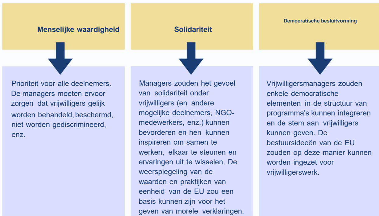
Tabel 5. Juridisch kader gebaseerd op niet-discriminerende EU-richtlijnen

Op waarden gebaseerd operationeel management van vrijwilligers zou kunnen worden gerealiseerd door procedures en beleid op één lijn te brengen met de waarden van de EU. De vrijwillige managers zouden bijvoorbeeld de EU-waarden kunnen integreren in de strategische besluitvorming, projectplanning en uitvoering. De waarden van de EU zouden normatieve criteria kunnen zijn voor evaluatie- of vrijwilligersprogramma's en -projecten. Communicatie op basis van de waarden van de EU kan de verplichtingen en verantwoordelijkheden van het programma aan het licht brengen.